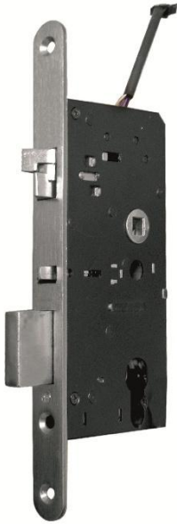
Poglądowe zdjęcie zamka wpuszczanego

Zamek elektromechaniczny wpuszczany w skrzydło drzwi, przeznaczony do drzwi prawych, otwieranych na zewnątrz, po otrzymaniu impulsu prądu stałego, wewnętrzny silniczek odblokowuje przekładnię mechaniczną, umożliwiając tym samym otwarcie drzwi, wraz z szyldem serii ELH stanowi kompletny zamek elektromechaniczny z elektroniczną kontrolą dostępu