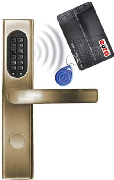
Poglądowe zdjęcie zamka szyfrowanego

Szyld zamka elektromechanicznego z kontrolerem dostępu na kartę magnetyczną oraz zamek szyfrowy, przeznaczony zarówno do drzwi lewych jak i prawych, po uzupełnieniu o zamek wpuszczany z serii ELB stanowiąc będzie kompletny zamek elektromechaniczny z elektroniczną kontrolą dostępu, na zewnętrznym korpusie szyldu znajduje się magnetyczny czytnik kart zbliżeniowych oraz klawiatura numeryczna, po zbliżeniu do czytnika karty lub wprowadzenia poprawnego kodu PIN następuje zwolnienie blokady wewnątrz zamka.